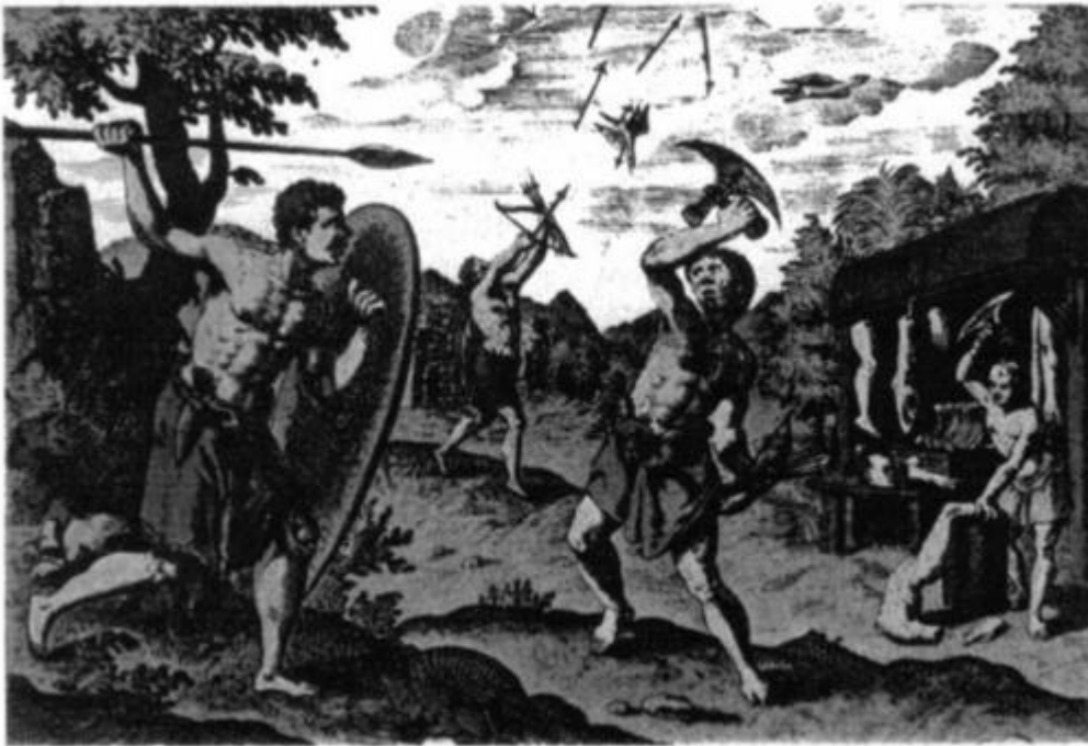
Figura 5- ‘Indígenas do Congo’ retratados como canibais.