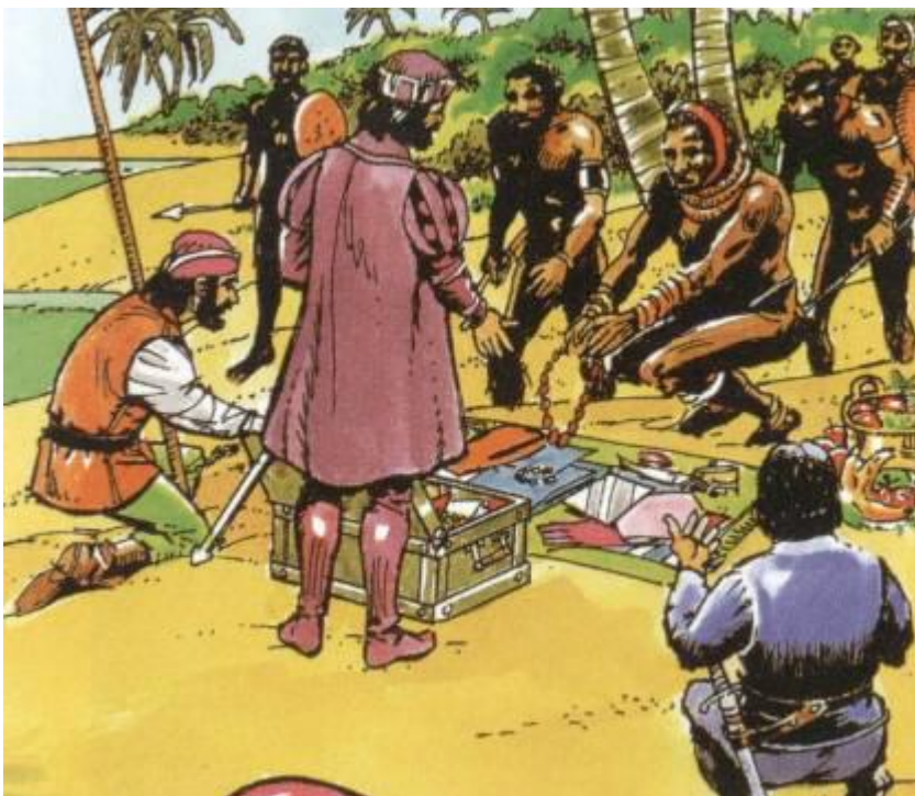
Figura 6- Representação do comércio entre portugueses e africanos.