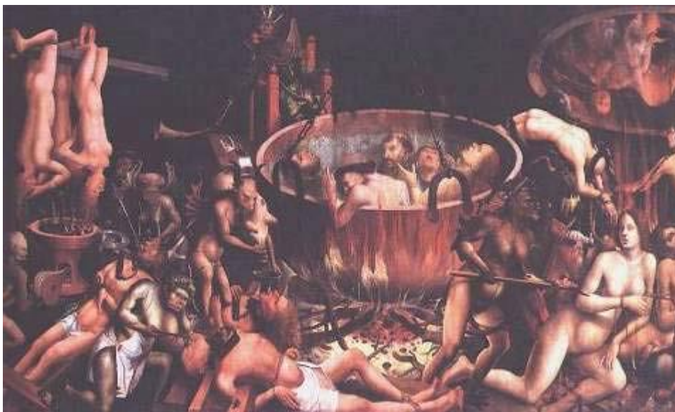
Figura 1- Pictografia do final do medievo que representa uma das visões do inferno no imaginário medieval. O diabo, sentado em seu trono no alto da imagem, possuía cor negra.