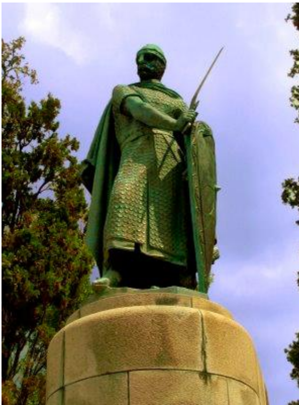
Figura 8- Estátua de D. Afonso Henriques (em Guimarães) que conquistara Lisboa em 1147. Fonte- http://pontesluso-galaicas.blogspot.com/2009/06/afonso-henriques.html , (19-05-2017; escultura da autoria de Soares dos Reis).