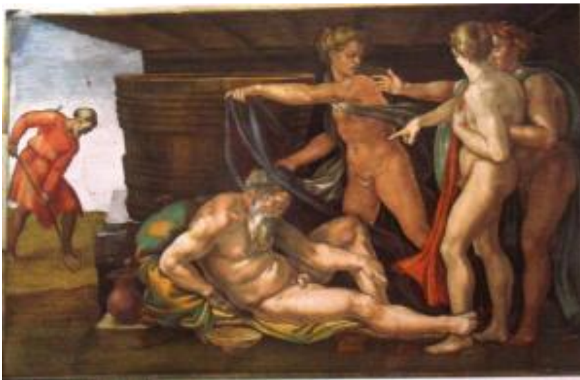
Figura 11- Pintura da Capela Sistina no Vaticano reproduzindo o episódio da embriagues de Noé