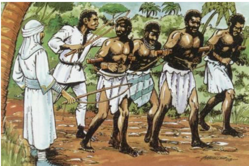
Figura 4- Africanos escravizados.