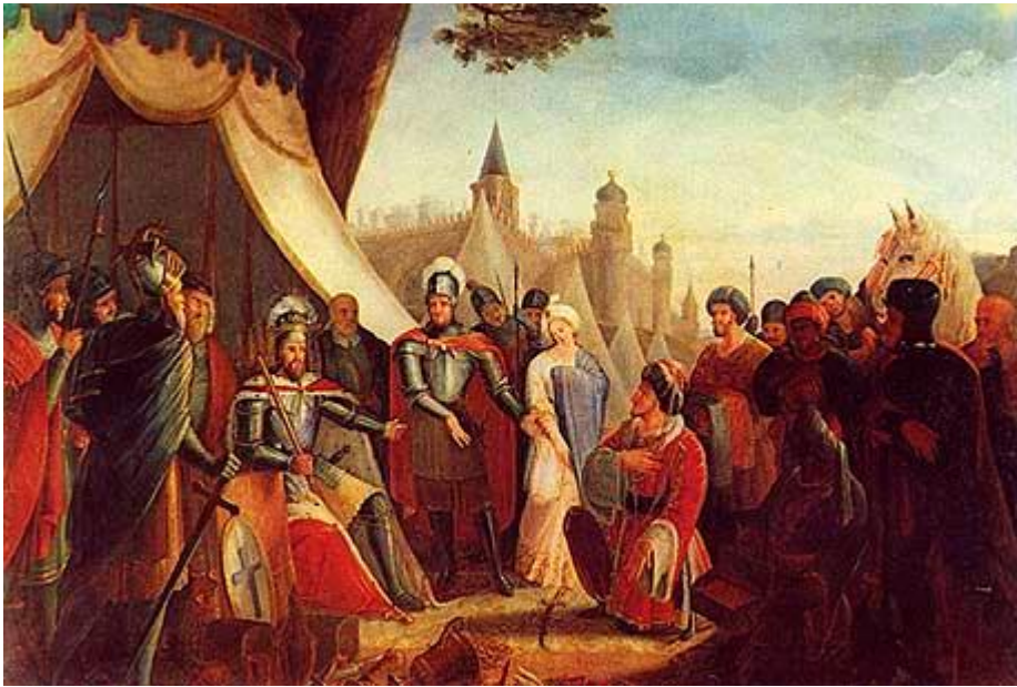
Figura 9- A rendição muçulmana no cerco de Lisboa.

Fonte: http://pt.wikipedia.org/wiki/Ficheiro:Siege_of_Lisbon_-_Muslim_surrender.jpg , (19-05-2017; gravura de Joaquim Rodrigues Braga).