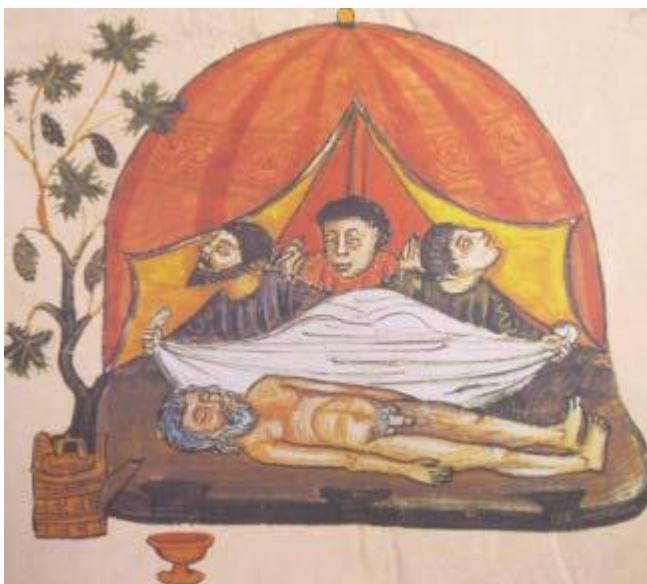
Figura 2- Reprodução da cena bíblica na qual Cam surpreende seu pai embriagado e desnudo em sua tenda. As posturas de Sem e Jafet representam o respeito e o temor em flagrar a nudez de Noé, já a de Cam revela o desrespeito que iria resultar na punição de sua descendência na Terra. (Iluminura do século XV encontrada em uma tradução da Bíblia hebraica para o castelhano, de autoria do padre Don Luis De Guzmán).