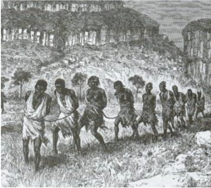
Figura 7- Africanos escravizados.